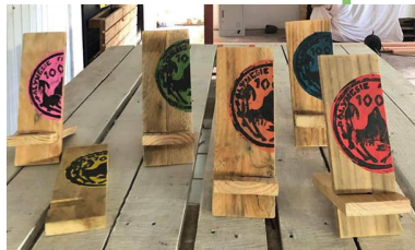
Exemple : Concrètement Design est une entreprise locale qui pratique l'upcycling.

Ainsi, certains produits de consommation courante peuvent également provenir de matériaux recyclés.